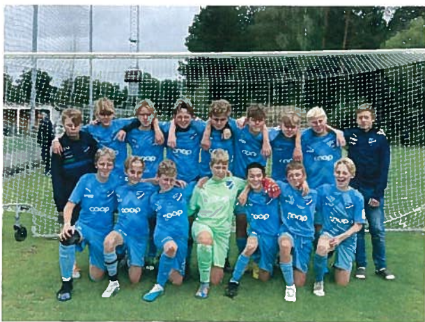
Laget på Katrineholm cup i augusti 2023