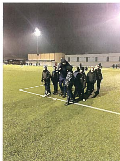
Träning på Säve