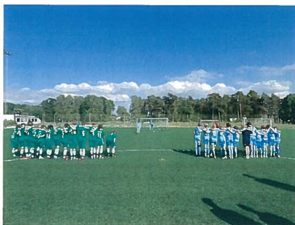
Straffar mot Hammarby IF under Gotland sommarcup i juni