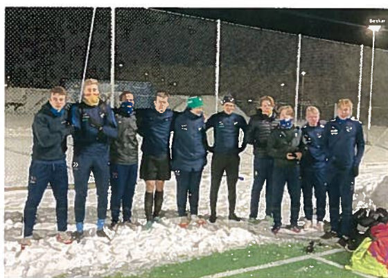
Vinterträning på nya Visborgsvallen