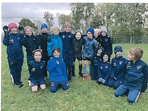
Träning i Vibbleparken